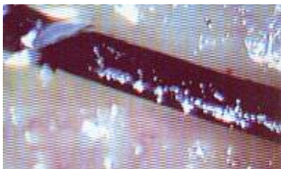
Cuero cabelludo con grasa

La seborrea es un problema cuyo origen radica en el interior aunque su detección es por lo general en el exterior. Normalmente la seborrea se deja sentir en la piel y en el cabello cuando el saquito folicular esta lleno aunque existen seborreas como la aparente que, aunque existe una seborrea localizada en el exterior en el interior es inexistente.