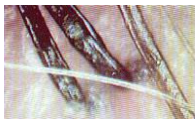
Cuero cabelludo normal

La seborrea viene producida normalmente por una hiperfunción de las glándulas sebáceas, estas segrean más grasa de lo normal.